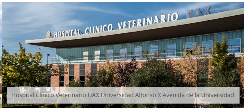
Hospital Clínico Veterinario UAX Universidad Alfonso X Avenida de la Universidad