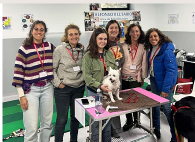
PRACTICA INTENSIVA: 1-6 RATIO DE INSTRUCTOR - ESTUDIANTE