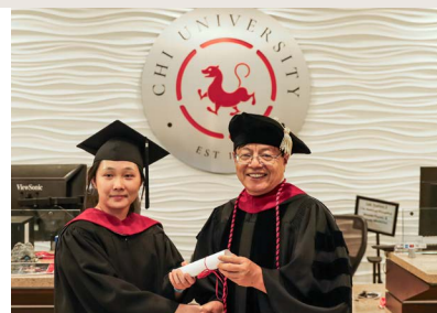
CONVALIDA HASTA UN 25% DE LA MAESTRÍA MVTC DE CHI

Web: chiu.edu/courses/ACUP102_ESP_ES Email: Spain@chiu.edu