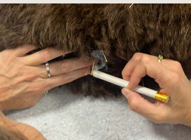
APRENDE DEL MAESTRO EN ACUPUNTURA VETERINARIA