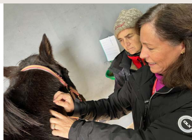
UNA OPCIÓN MÁS PARA SUS PACIENTES