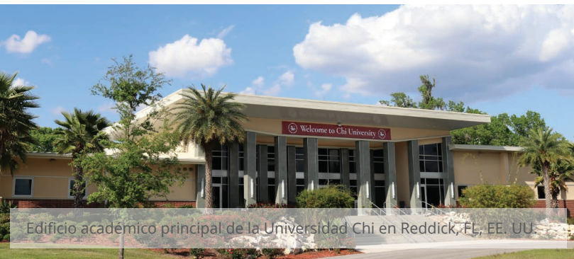
Edificio académico principal de la Universidad Chi en Reddick, FL, EE. UU.