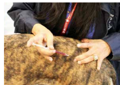
水鍼 (アクアアキュパンクチャー)