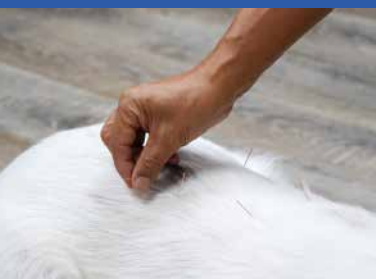
白針 (ドライニードル)