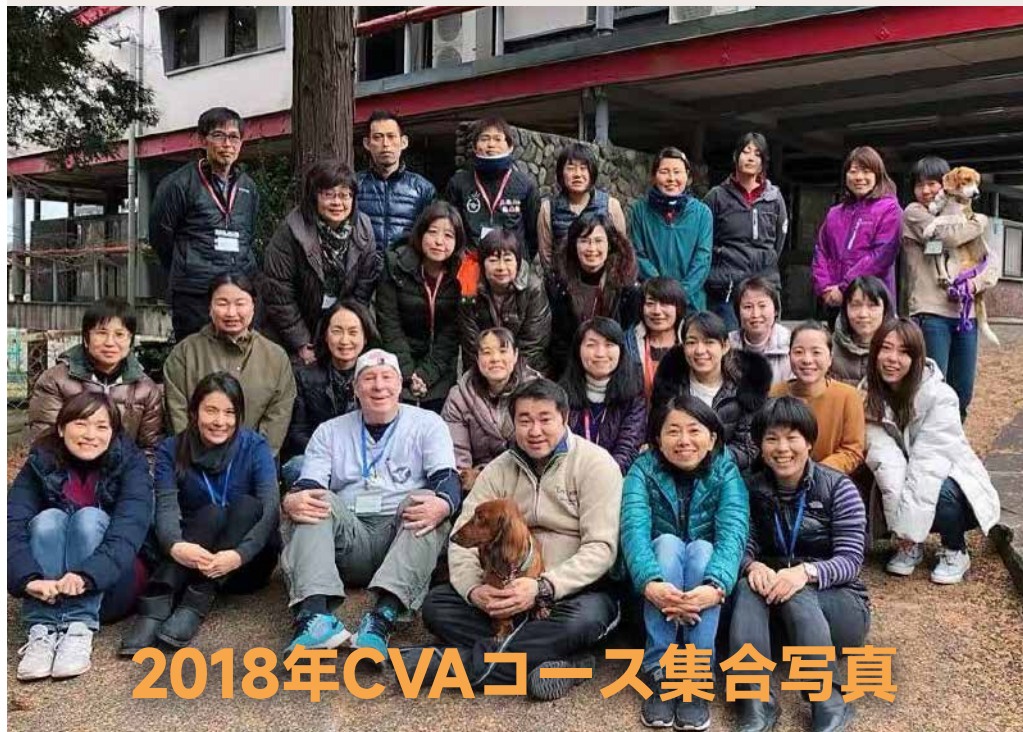
2018年CVAコース集合写真