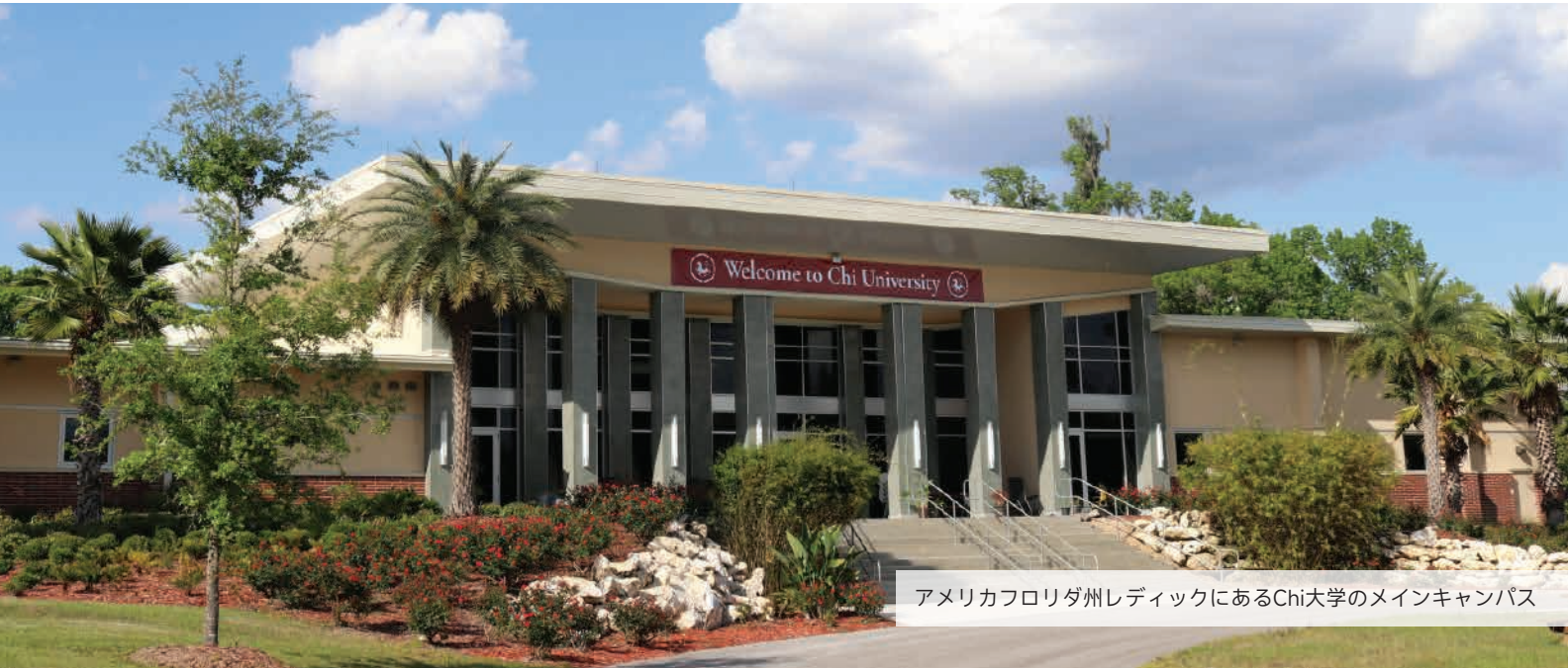
アメリカフロリダ州レディックにあるChi大学のメインキャンパス