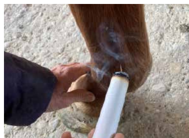
灸法 (モキシバシオン)