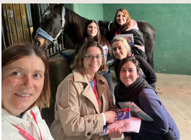
PRACTICA INTENSIVA: 1-6 RATIO DE INSTRUCTOR - ESTUDIANTE