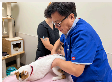
UNA OPCIÓN MÁS PARA SUS PACIENTES