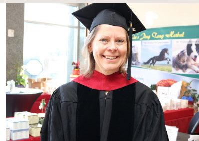
CONVALIDA HASTA UN 25% DE LA MAESTRÍA MVTC DE CHI

Web: chiu.edu/courses/ACUP102_ESP_ES Email: Spain@chiu.edu