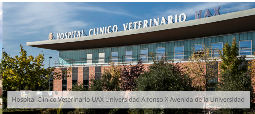
Hospital Clínico Veterinario UAX Universidad Alfonso X Avenida de la Universidad