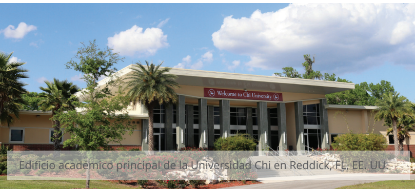
Edificio académico principal de la Universidad Chi en Reddick, FL, EE. UU.